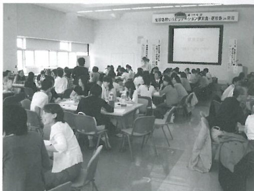
写真 1 全国訪問リハビリテーション研修会 in 新潟

平成 19 年 3 月の 1 カ月間、当院の訪問リハ実施件数は 1,085 件であり、うち医療保険が 86 件 (8%)、介護保険が 999 件 (92%) でした。介護保険の 999 件のうち、当院が主治医であるのは 11.6% です。当院の訪問リハの特徴の一つは、他院からの指示を受けて訪問リハを実施している率が高いことです。さらに訪問リハの対象地域が広いことも当院の特徴の一つです。その地域の面積は 627 平方 km であり、東京 23 区がちょうどすっぽりと入ります。かつ、約 98% の利用者から交通費を頂戴していません。介護保険制度が開始された平成 12 年に当院の院長である医師の荻莊則幸が「必要な人がいる以上、訪