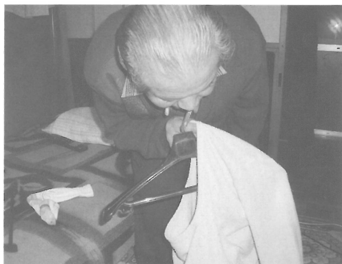
図Ⅲ-30 ハンガーに洗濯物をかける左片麻痺の男性 ハンガーを口にくわえている。