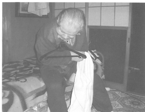
図Ⅲ-31 ハンガーに洗濯物をかける左片麻痺の男性 ハンガーを顎で挟みこんでいる。

車椅子使用者には、洗濯機を床面に半分埋め込むことで洗濯物を取り出しやすくする方法もある。