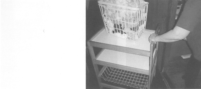
図Ⅲ-32 洗濯物をキャスター付きのワゴンで運ぶ片麻痺の女性

⑤ S字フック（針金でできたハンガーを折り曲げると代用できる）を使い洗濯バサミを胸の高さまで下げておく。すると、右上肢に洗濯物をつかませて胸の高さまで持ち上げ、非麻痺側で洗濯バサミをつまむことができる。