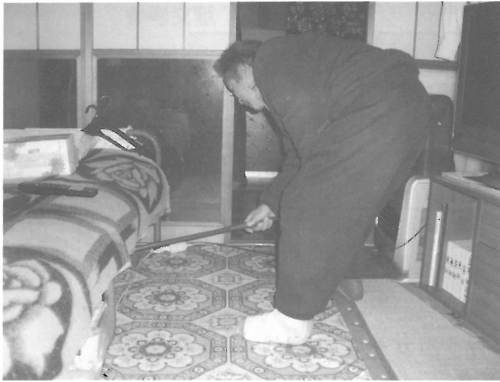
図Ⅲ-25 ベッドの下をモップがけする 左片麻痺の男性