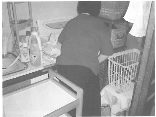
図Ⅲ-29 洗濯機から洗濯物を取り出す右片麻痺の女性 洗濯機に寄りかかることで立位を安定させている。