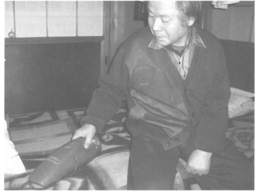
図Ⅲ-26 ハンディタイプの掃除機を使う 左片麻痺の男性

いからであろう。したがって、訪問リハに携わるセラピストが自分の価値観で判断し、「部屋が汚れているのだから掃除をすべきだ」という発言をすることや、そのような態度を取ることは断じて慎まなければならない。