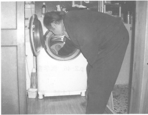
図Ⅲ-28 ドラム式の全自動洗濯機から衣類を取り出す左片麻痺の男性