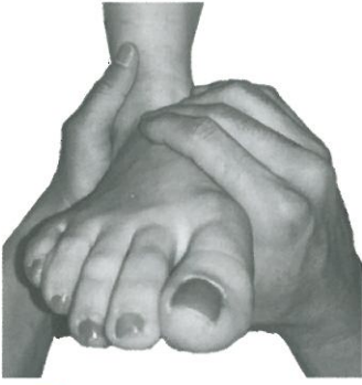
図1 前額面での操作法 踵骨、距骨頸、舟状骨、足長軸 を中心として触れる