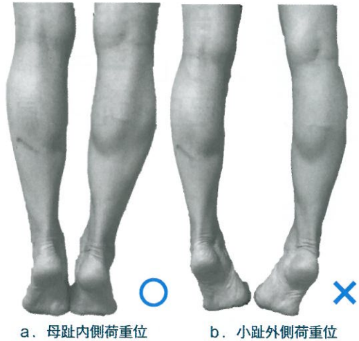
図7 足関節の内反・外反が伴わないよう、下腿三頭筋の筋力トレーニングを行う

段階的に座位から行い、次に立位からのつま先立ちを行う。その際は足関節が内反・外反とならないよう中間位で底屈運動を行う。