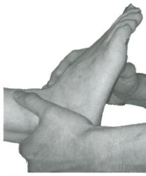
図2 矢上面での操作法 踵骨を把持しながら足底面 に対し前足部の配列を水平 に保ち、距骨が前方突出し ないよう触れる