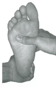
図3 水平面での操 作法 踵骨と足長軸を垂直 に合わせる