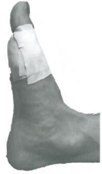
図4 中足指節 関節の固 定